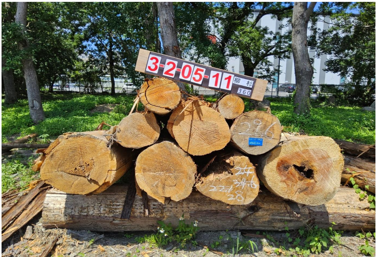
柳杉(不分徑-材質略不良)