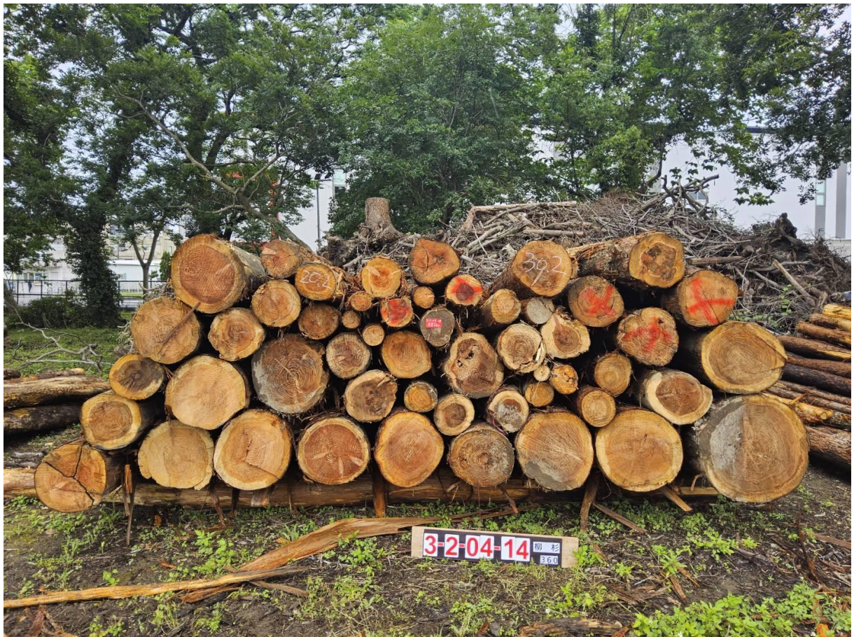
柳杉(不分徑-材質略不良)